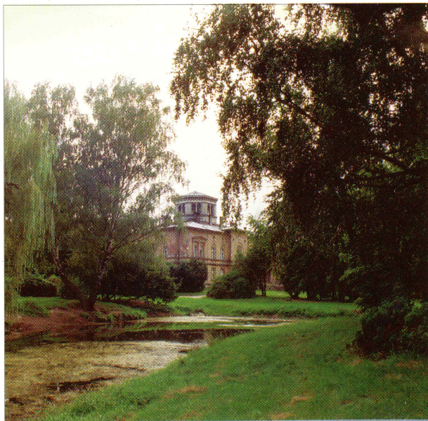
Pałac w Klęce.

Dębno - wieś przy przeprawie promowej na Warcie. Kościół parafialny p. w. Wniebowzięcia N. P. Marii, ufundowany w 1444 r. przez prymasa Wincentego Kota z Dębna, gotycki, orientowany, murowany z cegły w układzie polskim; jednonawowy, nakryty stropem z 1900 r.