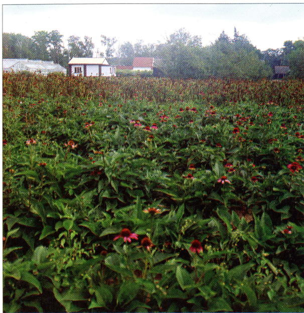
Plantacja jeżówki purpurowej w Kłęce