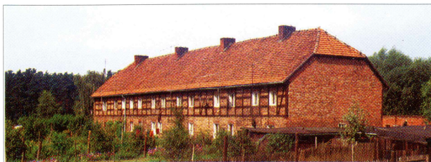
Spichlerz z 1 poł. XIX w. na Piaskach.

N owe Miasto nad Wartą - wzmiankowane już w 1283 r. Przez prawie 700 lat posiadało ustrój miejski. Od 1934 r. jest wsią liczącą ponad 1500 mieszkańców. Rozwój Nowego Miasta wiązał się z położeniem przy przeprawie rzecznej na ważnym trakcie z Poznania do Kalisza. W średniowieczu było siedzibą wpływowego w Wielkopolsce rodu Doliwów. Na podmiejskich łąkach zachowało się grodzisko stożkowate, na którym, jak wykazały badania archeologiczne, pod koniec XIII i w XIV wieku wznosiła wieża mieszkalna o założeniach obronnych.