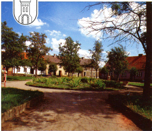
Rynek w Nowym Mieście n. Wartą

G mina Nowe Miasto nad Wartą położona jest w południowo-wschodniej części woj. poznańskiego, na pograniczu z woj. kaliskim. Przebiegają przez nią ważne połączenia drogowe i kolejowe z Poznania w kierunku Katowic. Gmina zajmuje obszar 120 km 2 , zamieszkały przez ponad 9 tys. osób. Siedzibą lokalnych władz samorządowych jest Nowe Miasto n. Wartą. Prawie 70% powierzchni stanowią użytki rolne, co decyduje o rolniczym charakterze gminy. Największym przedsiębiorstwem są znane w całym kraju Zakłady Zielarskie HERBAPOL w Kłęce S.A. Dużymi gospodarstwami rolnymi są Gospodarstwo Rolne Skarbu Państwa w Chociczy i w Wolicy Nowej. Pokażnymi magazynami dysponuje, znajdujące się w Wolicy Nowej, Okręgowe Przedsiębiorstwo Przemysłu Zbożowo - Młynarskiego. Północna granica gminy przebiega wzdłuż