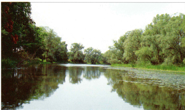
Stare koryto Warty w okolicy Wolicy Koziej.

Boguszyn - w niewielkim parku (1,4 ha) neogotycki dwór Szczanieckich, rodziny zaangażowanej w obronę narodowości polskiej w czasach zaborów. Na grobli przy stawie brama wjazdowa z tablicą upamiętniającą poległych w Powstaniu Listopadowym w 1831 r. Przedłużeniem grobli jest wiodąca do Boguszynka stara aleja wysadzana kasztanowcami.