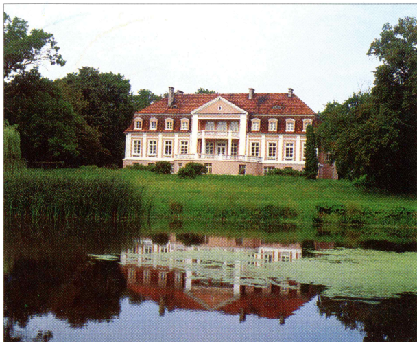
Pałac w Chociczy.

Boguszynek - drewniany kościółek p. w. św. Józefa Oblubieńca N.M.P., zbudowany w l. 1773-77, przeniesiony w 1975 r. z Kolniczek.