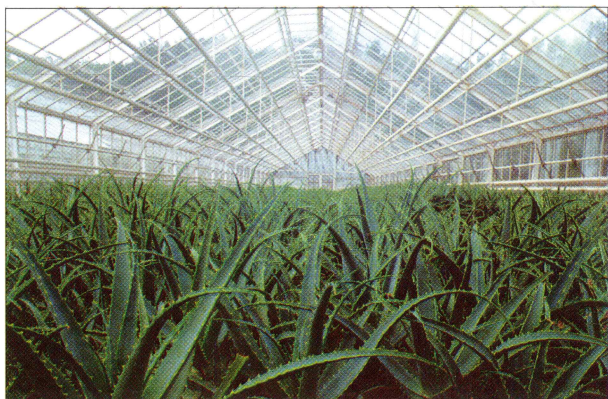
Uprawa aloesów w Kłęce.

kosmetycznego i spożywczego. Specjalnością Zakładów Zielarskich Herbapol w Kłęce jest produkcja leków roślinnych ze świeżych surowców zielarskich. Uprawa ziół i przetwórstwo roślin leczniczych w Kłęce ma blisko 50-letnią tradycję. Herbapol Kłęka S.A. wytwarza ponad 350 różnych fitopreparatów, w tym 39 gotowych leków roślinnych, kierowanych bezpośrednio na rynek farmaceutyczny.