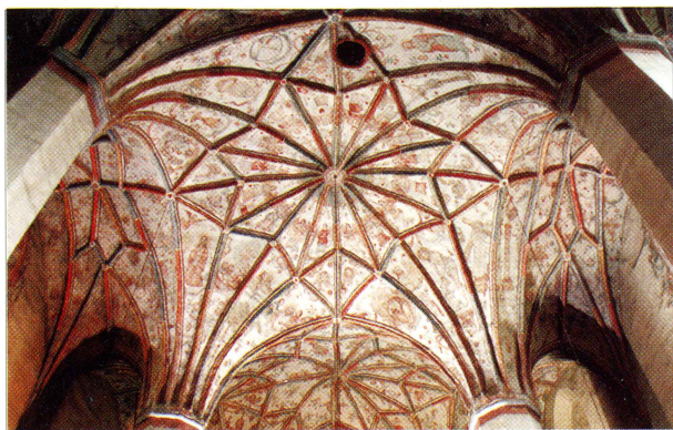
Kościół w Nowym Mieście - renesansowa polichromia z końca XVI w.

N owe Miasto nad Wartą - wzmiankowane już w 1283 r. Przez prawie 700 lat posiadało ustrój miejski. Od 1934 r. jest wsią liczącą ponad 1500 mieszkańców. Rozwój Nowego Miasta wiązał się z położeniem przy przeprawie rzecznej na ważnym trakcie z Poznania do Kalisza. W średniowieczu było siedzibą wpływowego w Wielkopolsce rodu Doliwów. Na podmiejskich łąkach zachowało się grodzisko stożkowate, na którym, jak wykazały badania archeologiczne, pod koniec XIII i w XIV wieku wznosiła wieża mieszkalna o założeniach obronnych.