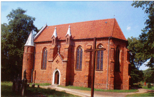
Kościół parafialny p. w. Wniebowzięcia N. P. Marii w Dębnie.

Wewnątrz m. in.: tablica erekcyjna z piaskowca i obraz św. Rozalii z XVII w. na ścianie południowej oraz późnogotycki krucyfiks z ok. 1520 r. i obraz "Vir Dolorum" z Matką Boską z pocz. XVI w., na ścianie północnej. Obok kościoła dzwonnica