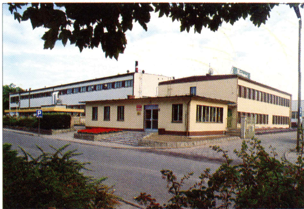
Zakłady Zielarskie Herbapol w Kłęce Spółka Akcyjna

H erbapol Kłęka S.A. zajmuje się uprawą i przetwórstwem roślin leczniczych oraz doświadczalnictwem zielarskim. Dominującym kierunkiem działalności spółki jest przetwórstwo zielarskie - produkcja leków roślinnych oraz preparatów zielarskich dla przemysłu farmaceutycznego,